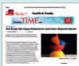
圖一、時代雜誌 (TIME) 報導內容

環醫中心近期之主要創新研發成果分述如下：利用串聯式液相層析質譜儀針對尿結石患者及美耐皿溶出三聚氰胺、苯二氮平類藥物及塑化劑等發表多篇論文，其中發表於JAMA Internal Medicine之論文顯示使用美耐皿餐具組吃麵之年輕志願者尿液測出8.35微克的三聚氰胺，比陶瓷餐具組者1.31微克多出約6~7倍。該篇論文在被接受刊登後也引起時代雜誌及路透社均於2013年1月23日報導(附圖一)。此外，鑑於近來分析科學的逐漸朝向綠色化學 (green chemistry) 的方向發展，因此在低耗能、低毒性、微小化與即時現場等分析潮流之下，環醫中心在重金屬檢測研發上也獲得創新的成果，主要利用所研發新穎之微流體 (Microfluidics) 結合感應耦合電漿質譜儀連線分析系統 (on-line microfluidics-ICP-MS analytical system)，配合自行設計組裝之PMMA (Polymethylmethacrylate) 微流體裝置填裝POMs奈米材料，並實際使用於重金屬物種分析(圖二)。本套微流體分離裝置 (CsPOM/MF separator) 在短時間內 (< 3 min) 有效區分出三價 (Cr (III)) 與六價鉻 (Cr (VI)) 物種，並進一步成功應用於環境水體樣品中重金屬物種之檢測。本系統除了不需有機溶劑使用外，微流體分析系統更提供了快速反應與縮短分析時間等優點。未來，此分析系統配合不同檢體前處理技術對於環境與生醫樣品中重金屬及其物種的檢測將更具實用性。