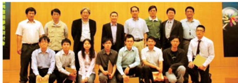
生命科學院年度學生論文壁報口頭競賽得獎同學與校外評審合照

在教研空間資源方面, 本人上任後, 發現相對於其他學院, 本學院空間過於狹小, 因此將「為學院爭取更大空間」列為最重要的工作之一。所幸, 學校新建國際學術研究大樓已近完工, 故有調整空間機會, 本學院終致爭取到約315坪空間, 相信本院老師於研究上與學生於教育上, 可獲得適當空間的舒緩, 希望在本學院全體師生共同努力下, 高醫生命科學院在各方面的表現一定可以百尺竿頭, 更進一步!