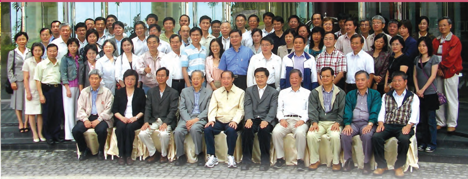
於台中清新飯店 舉行「96學年度主管共識營-主題：大學系所評鑑」