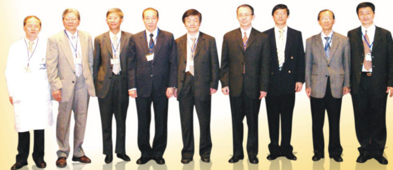
◎轉譯醫學研討會參與專題演講傑出學者合影

由於演講者均為具有國際水準的學者，而且經驗豐富，以深入淺出的方式表達，非常精彩，使參加者獲益良多。在未來，我們將舉辦更多類似的研討會，以傳遞更多的醫學研究新知。